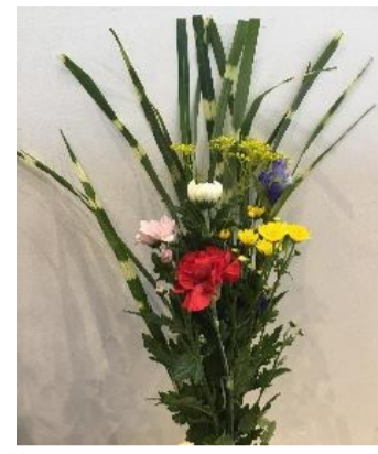
墓花（すすき・オミナエシ付） 980円+税（税込1,078円）