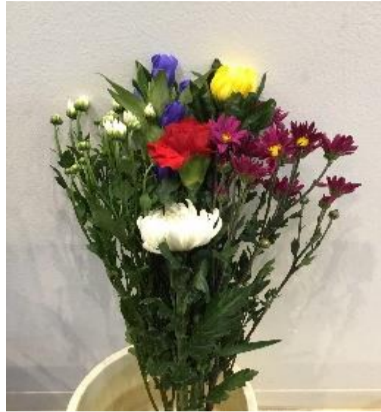
仏花 お盆用（並） 650円+税（税込715円）

予約期間：7月18日（土）～8月9日（日） 受取日時：8月10日（月）～8月13日（木）