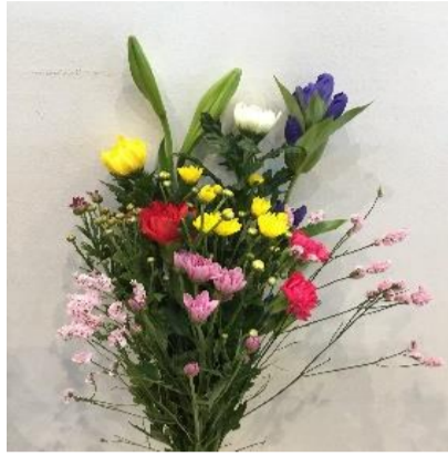
仏花 お盆用（上） 1,580円+税（税込1,738円）