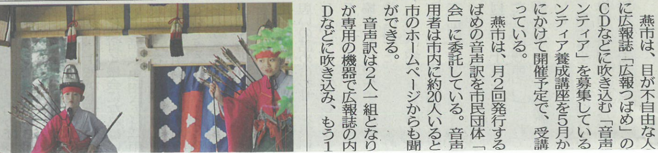
神職や稚児が優美な舞を奉 18日、弥彦村

20、21の両日は昔の遊び体験など各種イベントが催される。21日まで入館無料。 写真＝改装した燕市産業史料館の本館。職人紹介と作品の数々が並ぶ。新設した体験工房館。タンブラーの鋳目入れなどが体験できる。いずれも18日、燕市大曲